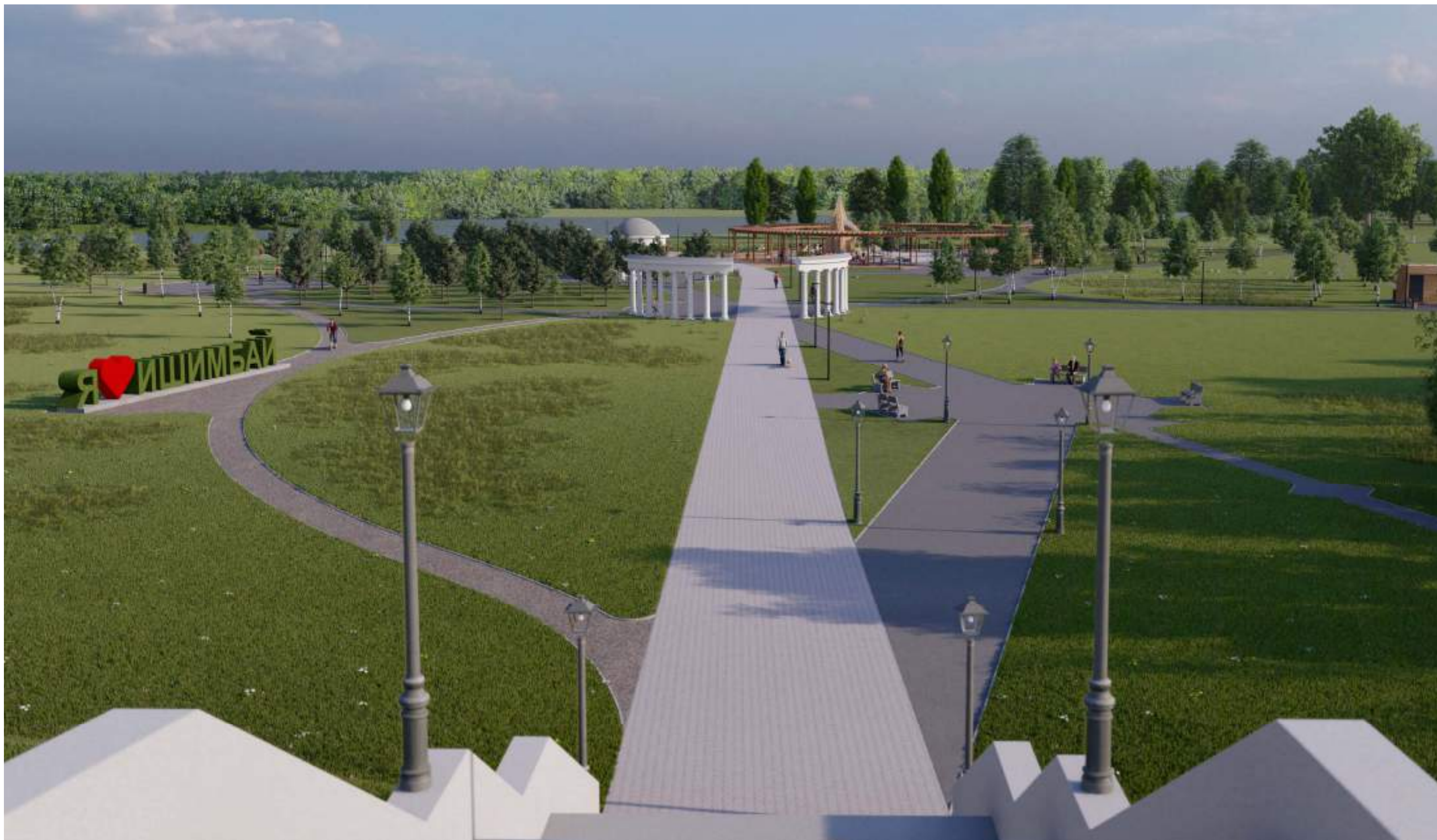
Вид на набережную с верхней существующей площадки городской аллеи

Визуализации предлагаемых проектных решений