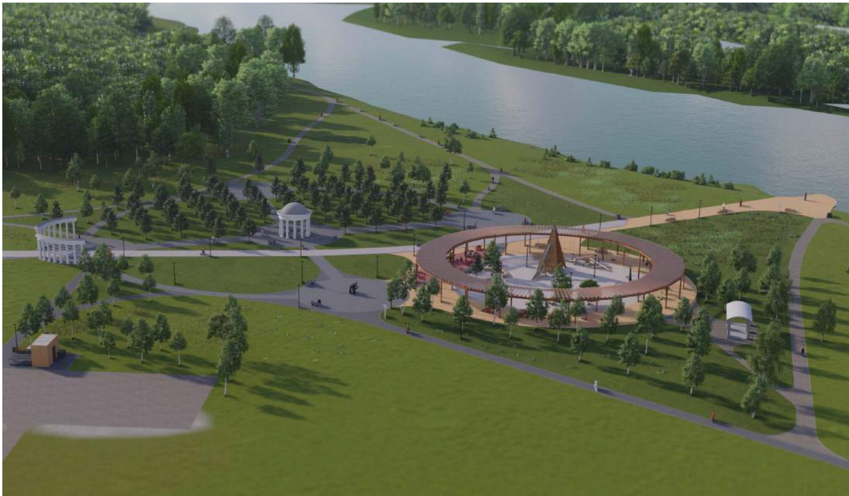
Общий вид на набережную с высоты птичьего полета

Визуализации предлагаемых проектных решений