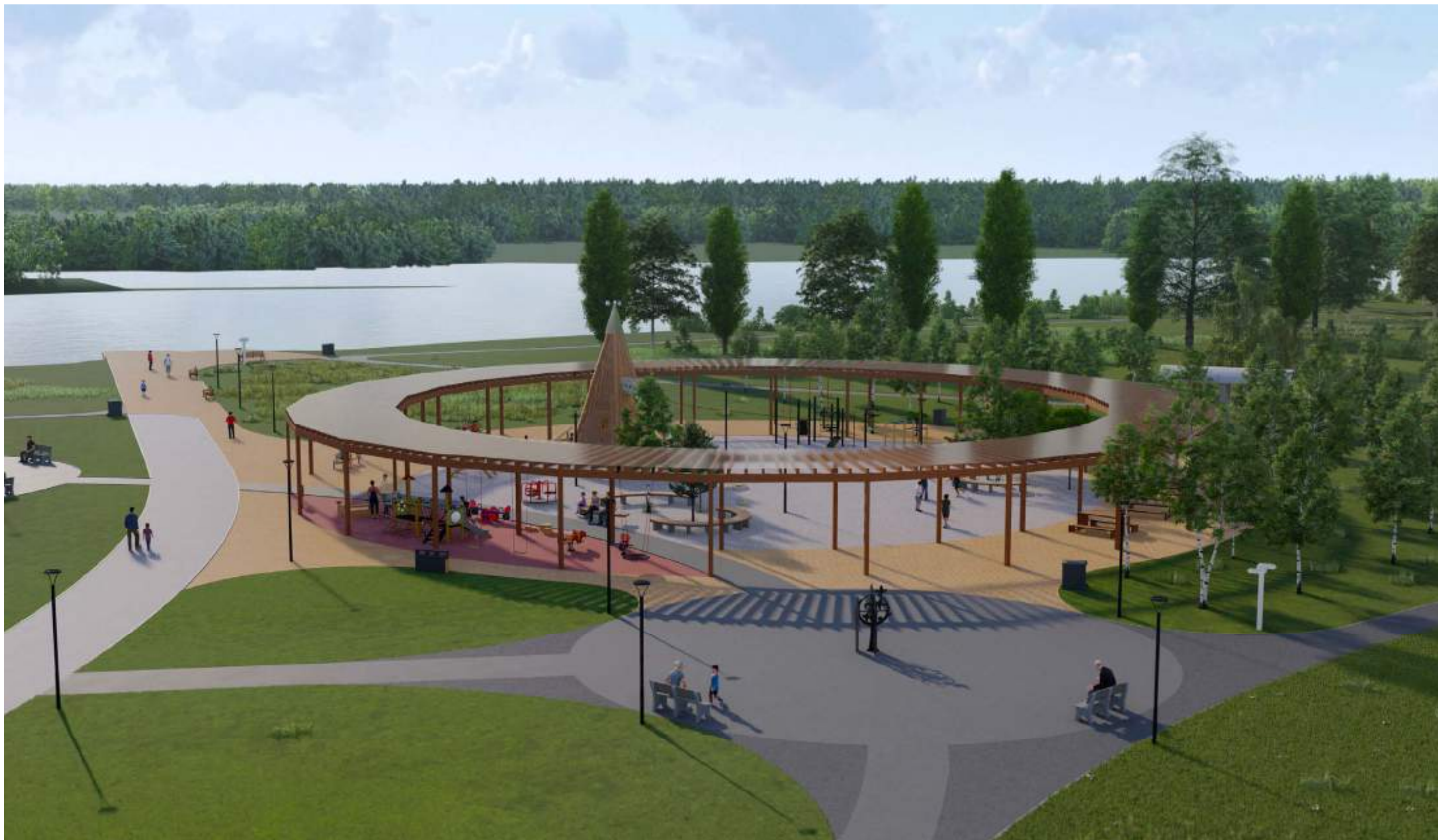
Вид на спортивно-игровую площадку с перголой, смотровой пирс с деревянным настилом

Визуализации предлагаемых проектных решений