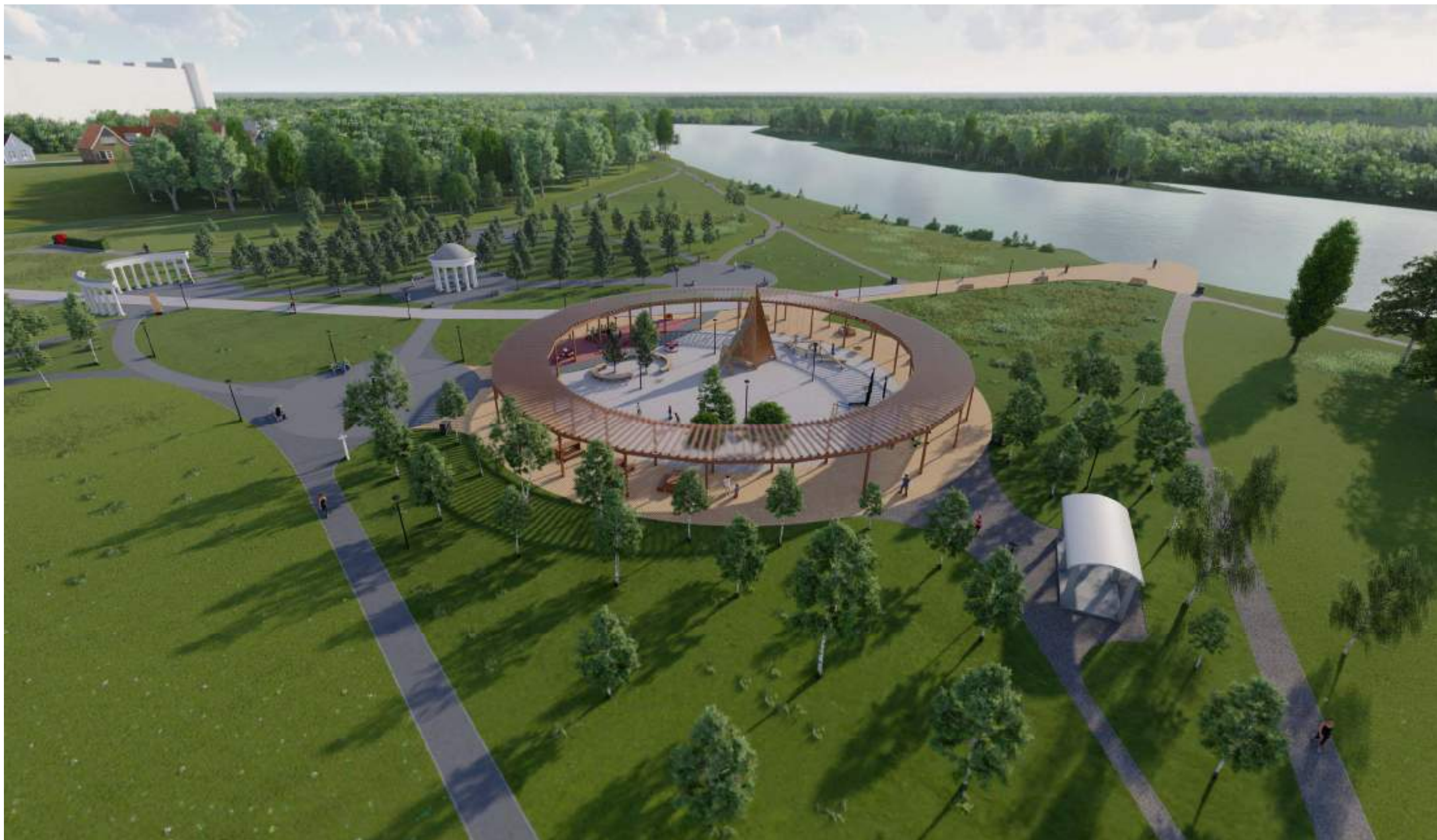
Вид на спортивно-игровую площадку с перголой, смотровой пирс с деревянным настилом, рошу с ротондой и колоннадой

Визуализации предлагаемых проектных решений