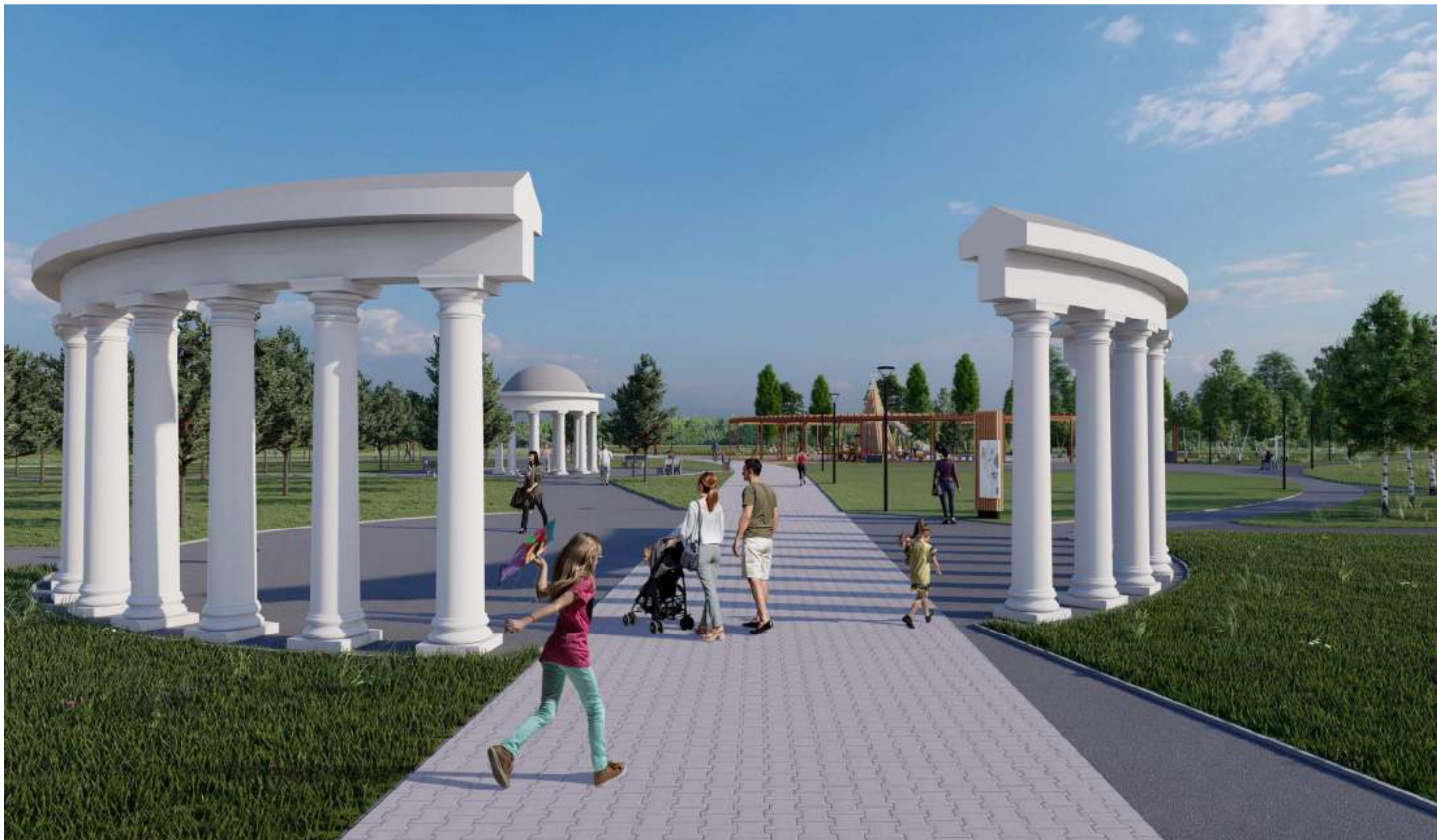
Вид на колоннаду, рощу с ротондой, спортивно-игровую площадку с перголой

Визуализации предлагаемых проектных решений